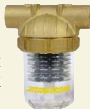
IL FILTRO MAGNUM AL MOMENTO DELL'INSTALLAZIONE SU UNA PRESSA AD INIEZIONE"

Questa contaminazione causa usura e un prematuro danneggiamento di componenti critici come pompe, resistenze e refrigeratori. L'installazione di un filtro Magnum® assicura che le canalizzazioni all'interno degli stampi vengano tenute pulite da detriti, che i tempi ciclo vengano mantenuti e che le macchie vengano ridotte. Tutto ciò senza i frequenti problemi di restrizione dei canali di flusso e di ostruzioni