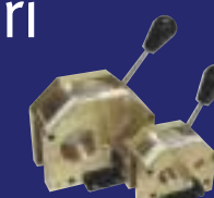
DISPONIBILE SOLO ATTRAVERSO NICKERSON IN ITALIA E NEGLI ALTRI PAESI EUROPEI