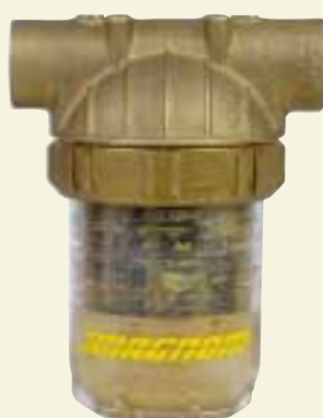
LE IMPURITÀ TRATTENUTE DAL FILTRO MAGNUM DOPO APPENA POCHÉ SETTIMANE