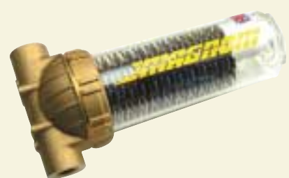
LA FLUID CONDITIONING SYSTEMS HA SELEZIONATO NICKERSON EUROPE COME CANALE DI DISTRIBUZIONE UFFICIALE PER L'EUROPA DELLA SUA GAMMA DI FILTRI MAGNETICI DESTINATI ALL'INDUSTRIA DELLA TRASFORMAZIONE DELLE MATERIE PLASTICHE.

Gli stampi e le attrezzature per stampaggio rappresentano un investimento enorme per i nostri clienti. Questi tipi di attrezzature dispongono di canalizzazioni d'acqua che possono facilmente venire ostruiti da formazioni di ruggine che conducono ad una riduzione di efficienza del sistema refrigerante e ai conseguenti costi di riparazione, fermi macchina e in conclusione ad una riduzione dei profitti.