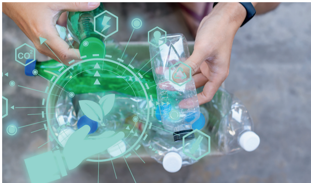
Focus L'importanza del riciclo della plastica

A seguire, i tre convegni previsti il 6 settembre: si partirà alle 10 in Sala Aries con "La circolarità della plastica: opportunità industriali, innovazione e ricadute economico-occupazionali per l'Italia", promosso da Amaplast, Unionplast e PlasticsEurope Italia, con The European House Ambrosetti, e in Sala Scorpione con "Polimeri per un'innovazione sostenibile", con Cesap e Iip (Istituto Italiano dei Plastici). Durante questo secondo evento si discuterà di come provare a innovare attra-