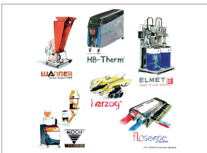
Partner produttivi Sono riconosciuti come leader per innovazione e qualità

In sostanza, l'impresa di Brembate di Sopra tratta gran parte delle attrezzature periferi-